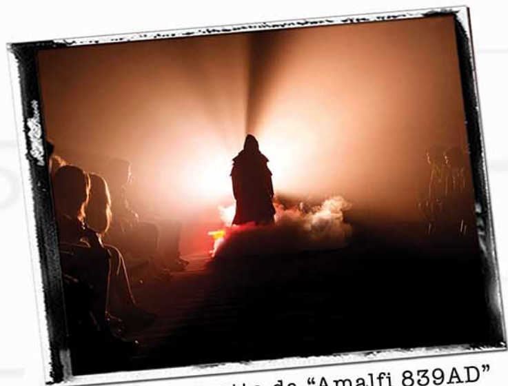
Una scena tratta da "Amalfi 839AD"

Ha fondato la società di produzione Workinmusical, che si occupa della gestione e promozione di altri spettacoli stabili (tra cui "Rebellion" e "That's Amore!") da lui scritti e diretti. Nel 2017 ha ottenuto i diritti di rappresentazione dello spettacolo statunitense "Murder Ballad" e ha iniziato il percorso di esportazione di "Amalfi 839AD" a Londra. Nel 2019 ha fondato un'etichetta musicale, in collaborazione con Pirames International, e un'agenzia dedicata ai performers teatrali. Tra il 2019 e il 2020 scriverà, produrrà e dirigerà due nuovi spettacoli stabili: Salerno Capitale e Il Mistero dell'Abbazia.